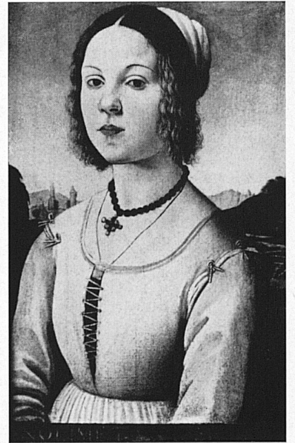
Ritratto di donna, dalla bottega del Verocchio, Firenze, XV secolo. Corpetto del Rinascimento italiano, con allacciatura semplice a cordoncino e maniche legate con nastri. La moda presa a modello per i costumi popolari!

Figure of a woman, from the workshop of Verocchio, of Florence. 15 th century. Early Italian Renaissance bodice with simple lacing and sleeves fastened at the top. Model for native costumes.