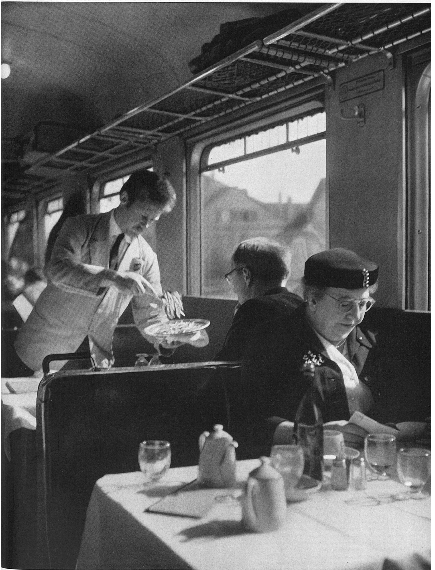
Aus welcher Richtung wir auch der HOSPE in Bern zustreben, der Speisewagen verkürzt den Fahrgästen der Bundesbahnen die Reise. Vor gepflegt gedeckten Tischen sitzen sie an großen Fenstern, das Wechselspiel der Landschaft und dasjenige eines sorgfältig zubereiteten Menüs genießend.