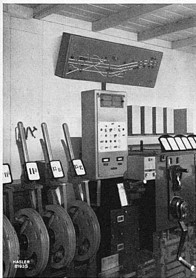
Stationsausrüstung für einen automatischen Block mit fernbedienter Blockstelle, angebaut an ein mechanisches Stellwerk. Rechts die Hebelsperren und in der Mitte der Bedienungsapparat.

vertraut vorbehaltlos auf die Betriebs-sicherheit der schweizerischen Eisenbahnen. Und dies mit vollem Recht, denn die Eisenbahntechnik ist heute so hochentwickelt, daß auch menschliche Unzulänglichkeiten weitgehend ausgeschaltet werden können.