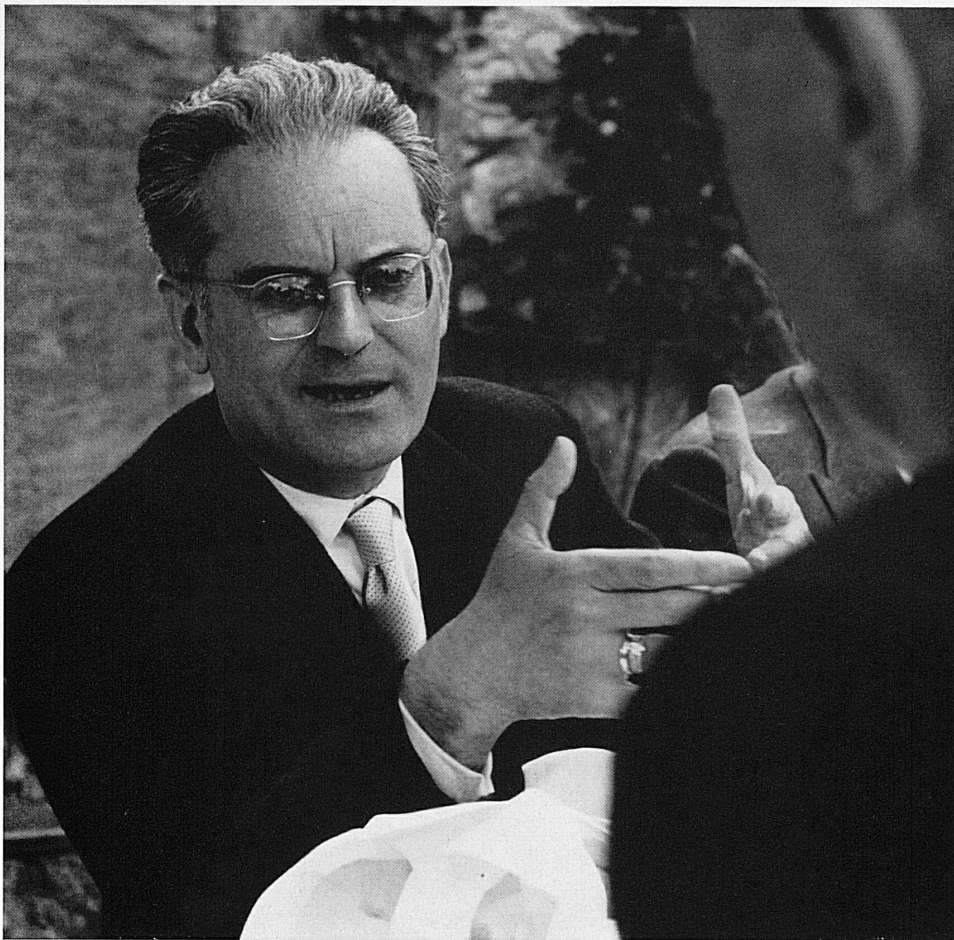
Bundesrat / Conseiller fédéral Dr. Giuseppe Lepori