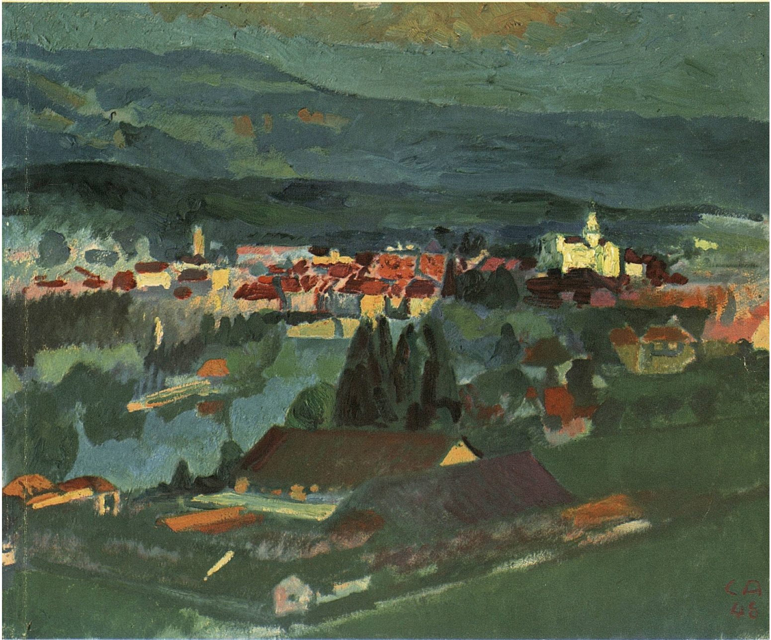
Cuno Amiet, 1948: Solothurn / Soleure / Soletta

Editore: Ufficio Centrale Svizzero del Turismo