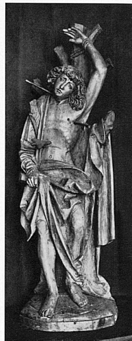
St. Sebastian, Geiler zugeschrieben 1. Viertel 16. Jahrhundert St-Sébastien, attribué à Geiler 1 er quart XVI e siècle

Sept./Okt. Casino-Kursaal: Täglich Konzerte, Dancing, Boulespiel.