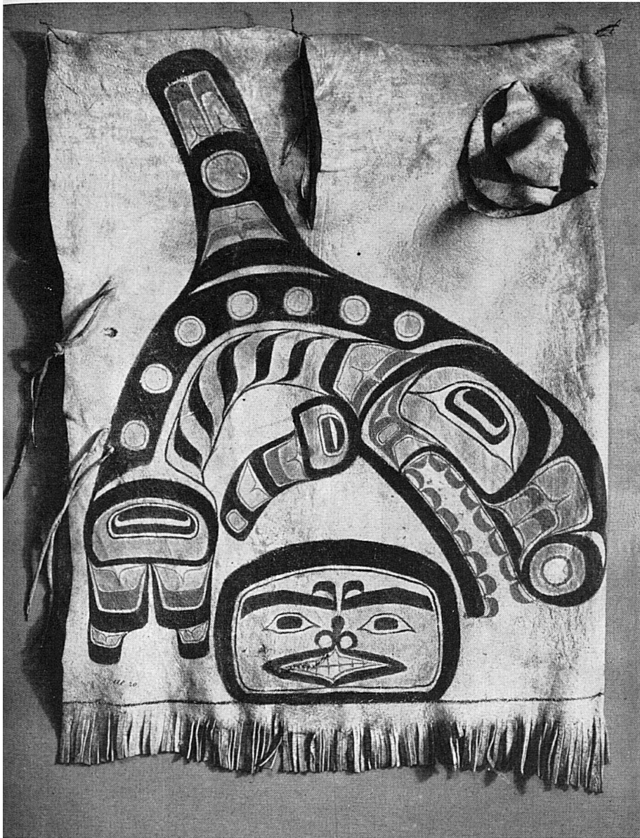
Überwurf aus Leder. Sammlung Bischoff, 1859; heute im Historischen Museum, Bern.

Cape de cuir. Collection Bischoff, 1859; actuellement au Musée historique de Berne.