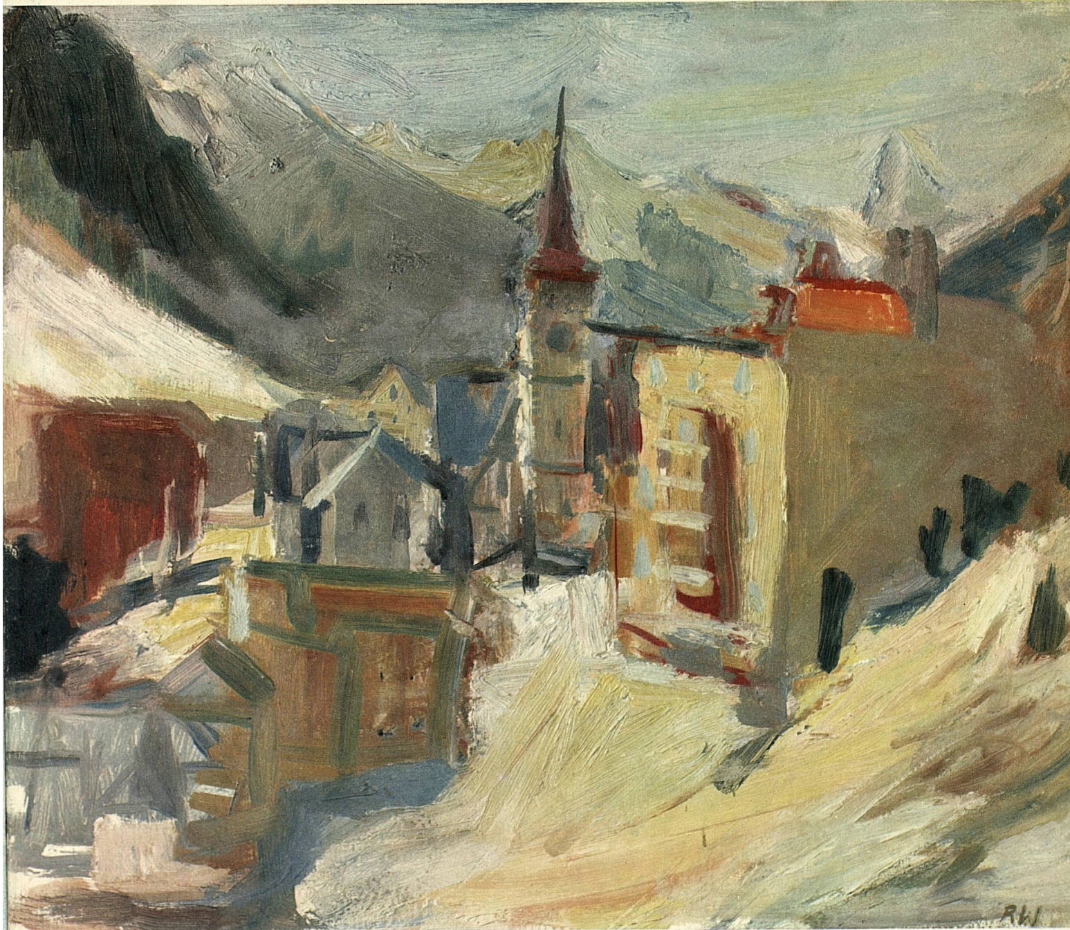
Robert Wehrlin: Das winterliche Davos (Graubünden) – L'hiver à Davos (Grisons) Inverno a Davos (Grigioni) – Winter in Davos (Canton of Grisons)

Editore: Ufficio Centrale Svizzero del Turismo