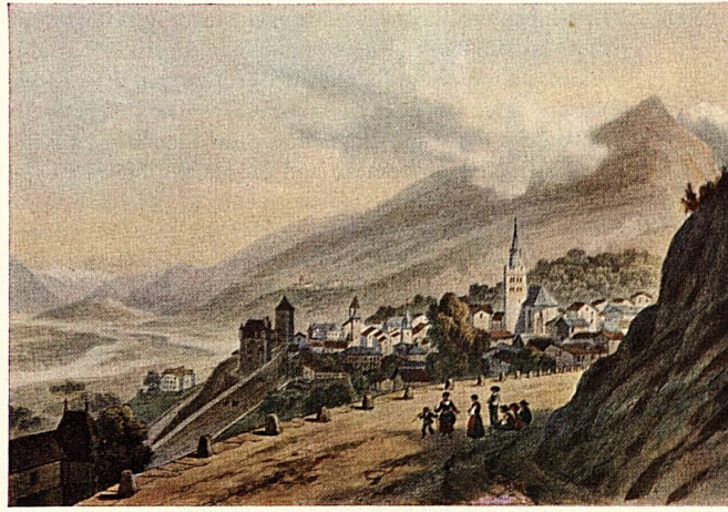
Deroy: Leuk und das Rhoneetal. Loèche et la Vallée du Rhône Leuk e la valle del Rodano. Loeche y el valle del Ródano. Leuk and Rhone Valley.

Very likely the Romans, around 196 A.D., developed an antique mule track into a road across the Simplon. Pilgrims often travelled over the pass in the 11th century. Pope Gregorius X used it in 1275 to go to Lausanne for the inauguration of the Cathedral. The Simplon Pass became more and more important as a link for international trade, especially after Kaspar von Stockalper, a Valais citizen, obtained authorization in 1634 from the city of Milan to transport goods between Italy and Switzerland. After his death there was little traffic across the Simplon, until the month of May 1800 when Napoleon used it as a passage for his soldiers and guns on their way to Italy. Five years later the Simplon pass was made accessible to cannon. Soon afterwards, i.e. about 150 years ago, the first mail coaches drove over it.