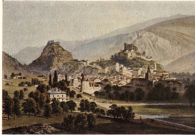
Sitten, die Hauptstadt des Wallis, 1. Hälfte 19. Jahrhundert. Sion, capitale du Valais, dans la première moitié du XIX e siècle. Sion, la capitale vallesana, nella prima metà del secolo XIX. Sion, capital del Valais, 1 a mitad del siglo XIX. Sion, capital of the Valais. First half of 19th century.