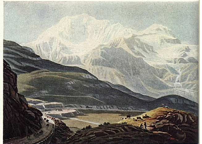
Gabriel Lory fils: Simplonpaß | Col du Simplon | Passo del Sempione | Paso del Simplón | Simplon Pass.

Un antico sentiero mulattiero è alle origini della strada romana sul Sempione, della quale si hanno le prime notizie intorno al 196 d. Cr. Nel secolo XI questo valico alpino fu frequentemente usato dai pellegrini. Papa Gregorio X lo percorse nel 1275, quando consacrò la cattedrale di Lozana. In seguito il valico del Sempione acquistò in modo sempre più pronunciato il carattere di strada commerciale. Esso assurse a importanza europea grazie all'iniziativa del Vallesano Kaspar von Stockalper, al quale i Milanesi accordarono nel 1634 la privativa dei trasporti di merci sul Sempione. Dopo la morte dello Stockalper il transito prese a languire sul passo, finchè nel maggio del 1800 le truppe di Napoleone ruppero il lungo letargo. «Reso praticabile ai cannoni», il valico divenne cinque anni dopo la prima strada carrozzabile delle Alpi e poco tempo dopo, circa 150 anni or sono, fu percorso dalla prima diligenza postale.