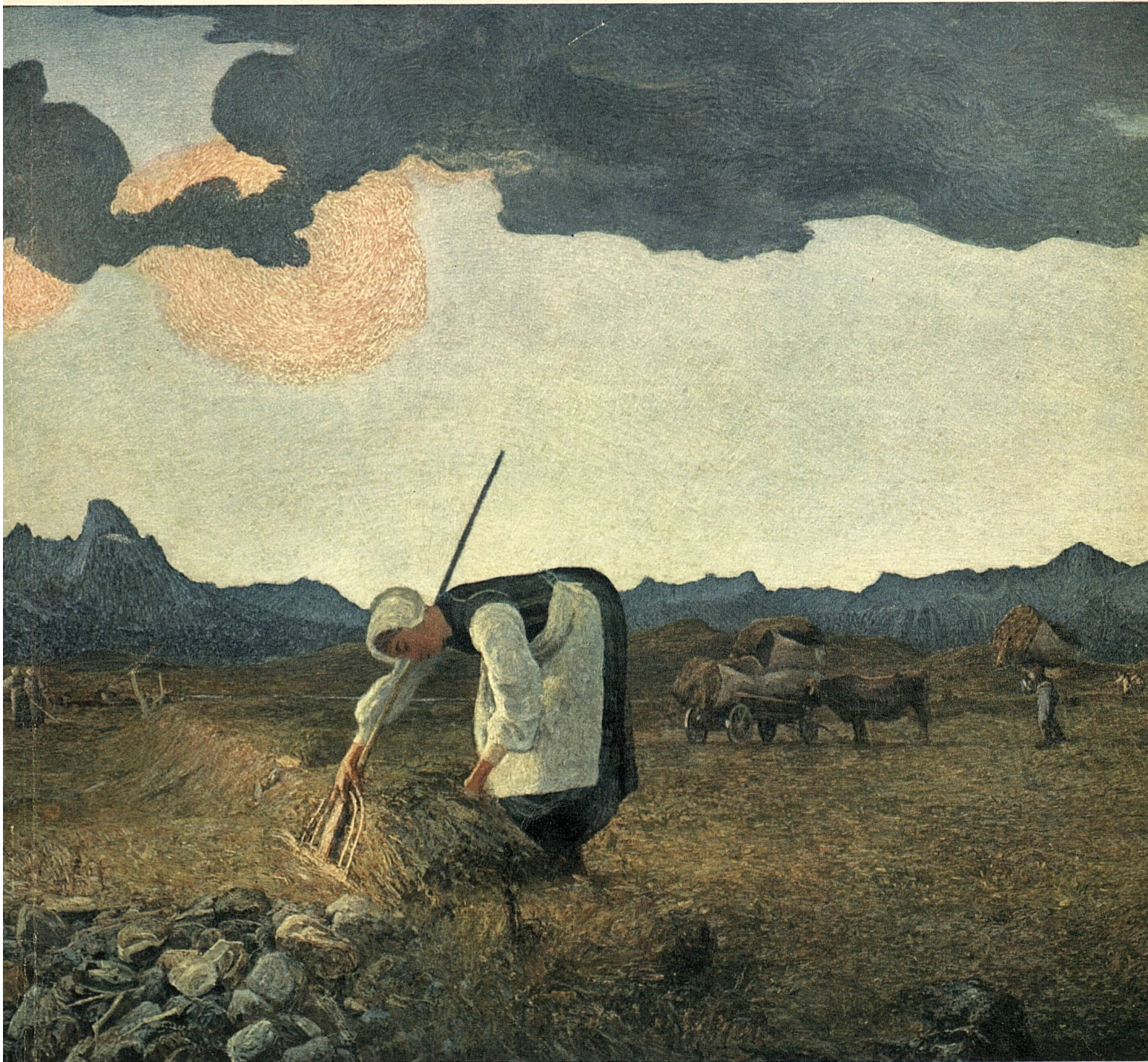
Giovanni Segantini, 1858–1899: « Die Heuernte » – « Les fenaisons » Aus dem Segantini-Museum in St. Moritz

Herausgeber | Editeur | Editore: Schweizerische Verkehrszentrale Office National Suisse du Tourisme • Ufficio Nazionale Svizzero del Turismo