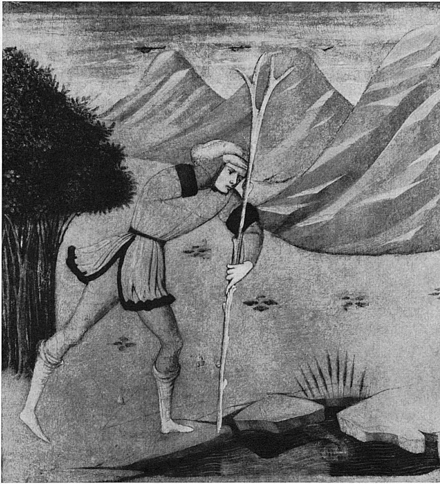
Meister des «Paris-Urteils»: Narziss betrachtet sein Spiegelbild