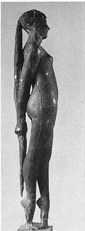
Manzù: Passo di danza Bronzo 1955