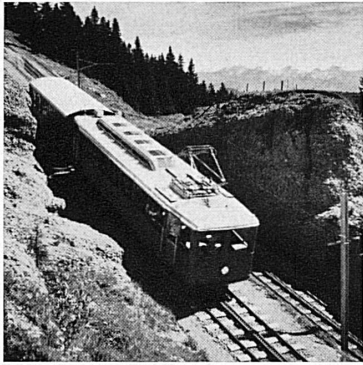
Vitznau-Rigi Kulm