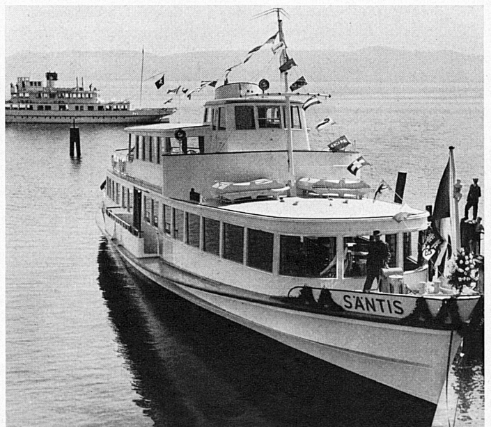
Das Motorschiff «Säntis» erwartete kürzlich die Gäste zur Jungfernfahrt

Durch die Wellen des Bodensees gleitet ein neues Motorschiff der Bundesbahnen, die den schweizerischen Verkehr auf diesem grossen Wasserspiegel seit dem Jahre 1902 betreiben. Vier Schiffe standen ihnen bisher zur Verfügung: zwei vor rund einem halben Jahrhundert erbaute Raddampfer und die zwei seit 1932 und 1933 in Betrieb stehenden Doppelschrauben-Dieselmotorschiffe «Thurgau» und «Zürich». Zu diesen gesellt sich nun das Motorschiff «Säntis», das 320 Personen befördern kann und das kürzlich, begleitet vom Jubel der Schuljugend, zu seiner Jungfernfahrt gestartet ist. Eine freundliche Atmosphäre umgibt seine Schiffsplätze (1. und 2. Klasse), denen auf dem Hauptdeck der einladend ausgestattete Restaurationsraum angegliedert ist. Schlingerkiele an den Bordseiten dämpfen das Rollen des Schiffes beim Wellengang eines Sees, der uns an gewittrigen Sommertagen Impressionen schenkt, die Erinnerungen an die Weite des Meeres wecken.