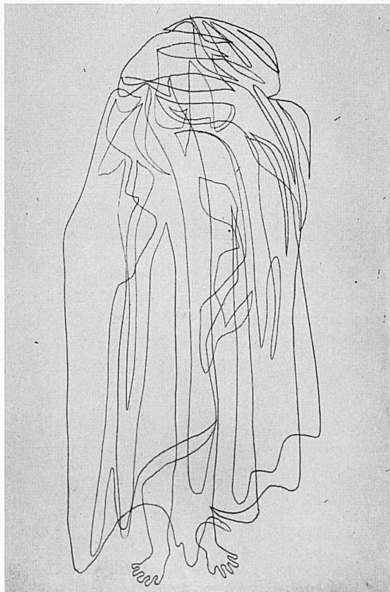
Paul Klee: Verhüllte Gestalt, 1931 Silhouette voilée, 1931 Figura velata, 1931 Veiled Figure, 1931