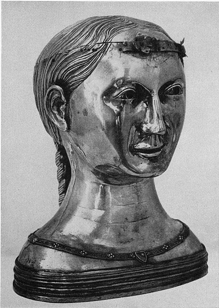
Silbervergoldetes Kopfreliquiar der heiligen Thekla. Anfang 14. Jahrhundert. Aus dem Rijksmuseum in Amsterdam. – Chef-reliquaire d'argent doré de sainte Thècle. Début du 14 e siècle. – Busto reliquiario d'argento dorato di Santa Tecla. Risale al principio del secolo XIV. – Silver and gold plated relic which belonged to St. Thekla. Beginning of the 14 th century.