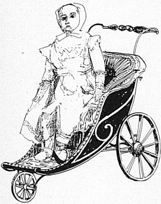
Kinderpuppe. — Poupée d'enfant. Pupattola per bambini. Child's doll. Zeichnung Heinz Keller, Seen-Winterthur.