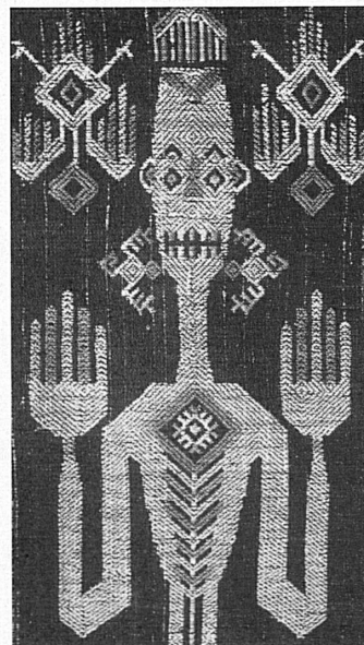
Sarong, aus Baumwolle gewirkt, mit figürlichem Dekor.

Sur la base de ces données, nous avons adopté, pour le circuit du rez-de-chaussée par exemple, un certain SCÉNARIO en passant successivement par les salles: Egypte pharaonique, Statuaire négro-africaine, Parures et Bijoux, Mauritanie, le Forgeron et ses techniques.