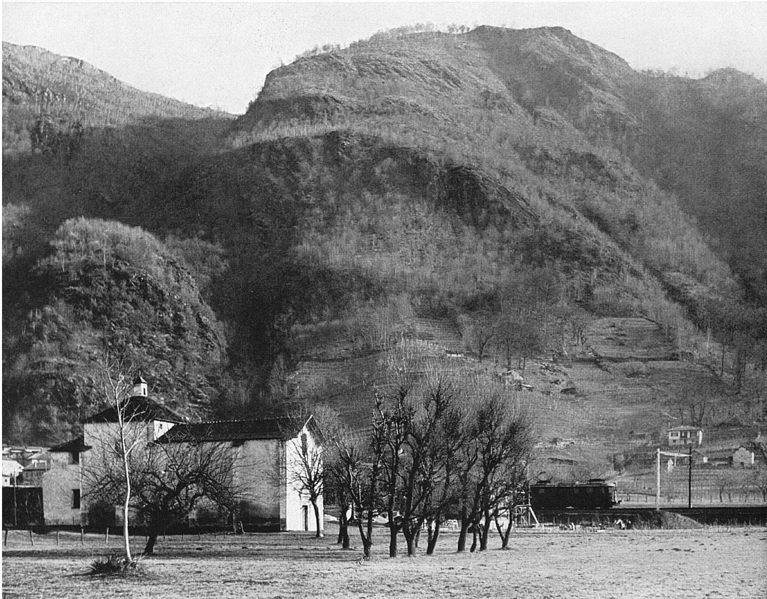
▲ Die Gotthardlinie bei Bironico am Monte Ceneri La ligne du Gothard près de Bironico, au pied du Monte Ceneri La línea del Gottardo vicino a Bironico, ai piedi del Monte Ceneri La línea del San Gotardo cerca de Bironico, en el Monte Ceneri The Gothard Line at Bironico on Mount Ceneri