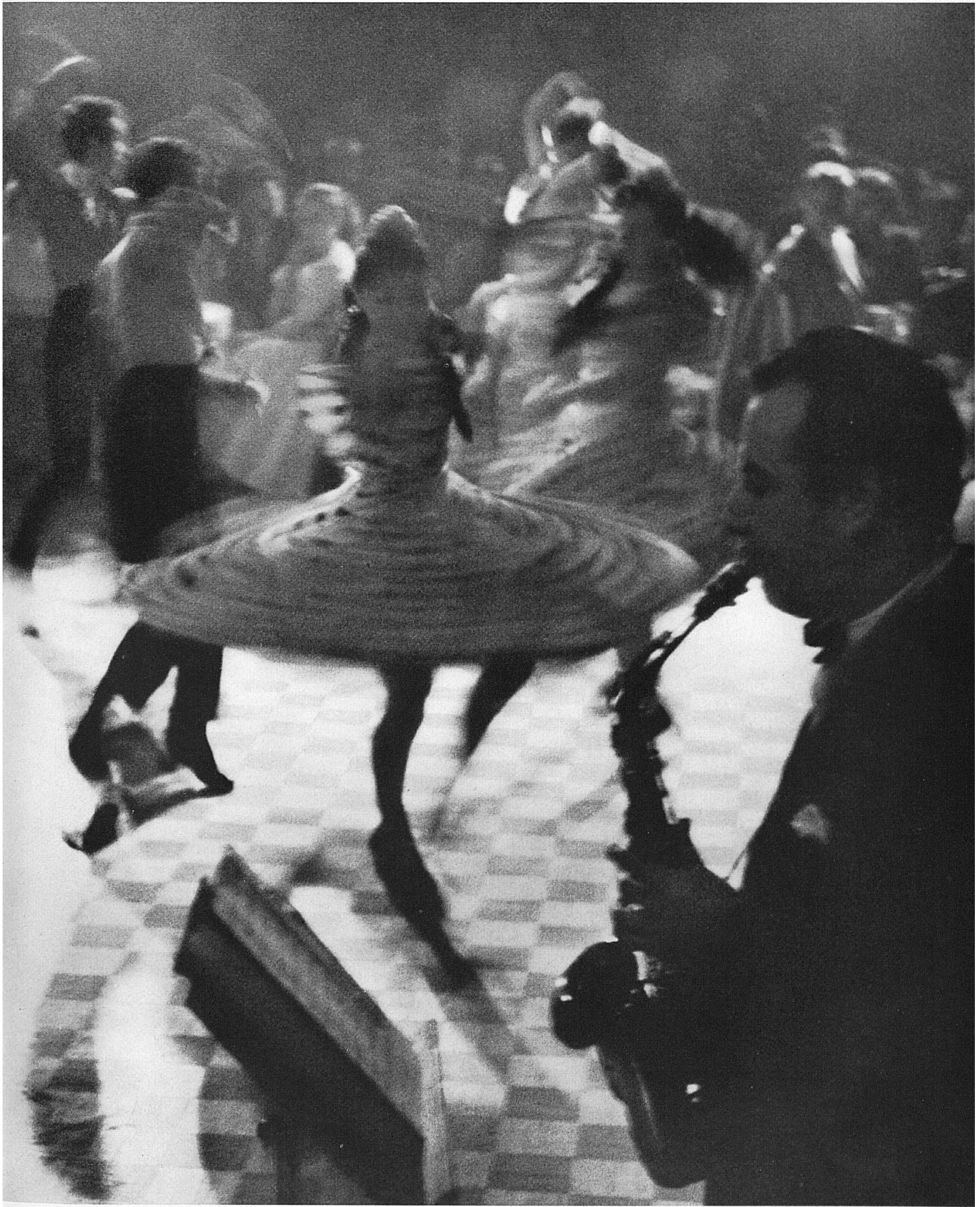
4 Aprikosenkulturen im blühenden Rhonetal bei Sitten im Wallis Cultures d'abricotiers dans la vallée du Rhône en fleurs, aux environs de Sion Coltivazioni di albicocche nella fiorita valle del Rodano vicino a Sion nel Vallese Apricot trees in blossom near Sion in the Rhone Valley