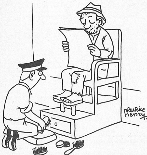
«Bitte auf Hochglanz!»

Seit Beginn des Jahres arbeitet in unserer Bibliothek eine Ungarin, die eine nette und tüchtige Kollegin ist. Nun erschien dieser Tage ein Ungar an unserer Ausgabestelle und erkundigte sich in gebrochenem Deutsch nach unseren Leihbedingungen. Natürlich riefen wir unsere Ungarin und nun wickelte sich diese Auskunft in ungarisch ab. Die ganze Sache dauerte nicht lange, brachte jedoch von einer ungeduldigen Abonentin folgende Reklamation ein: «Es isch scho nu haarig das me warte mues bis Privatschpröch erlediget sind.» Darauf unsere Ungarin: «Ich bitte Sie, es war ein rein geschäftliches Gespräch.» Und wieder die reklamierende Dame: «I weiß scho was geschäftlich und privat ischt, i cha denn öppe au italienisch! »