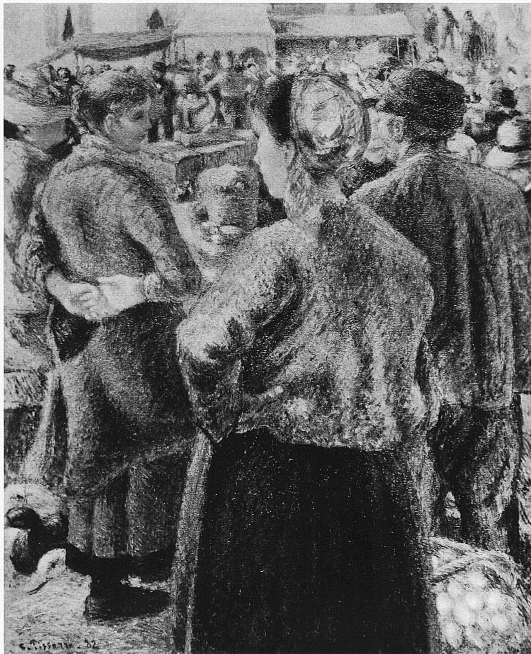
Camille Pissarro, 1882 Der Geflügelmarkt Le marché aux volailles Il mercato del pollame Poultry Market

AUSSTELLUNG / EXPOSITION CAMILLE PISSARRO KUNSTMUSEUM BERN