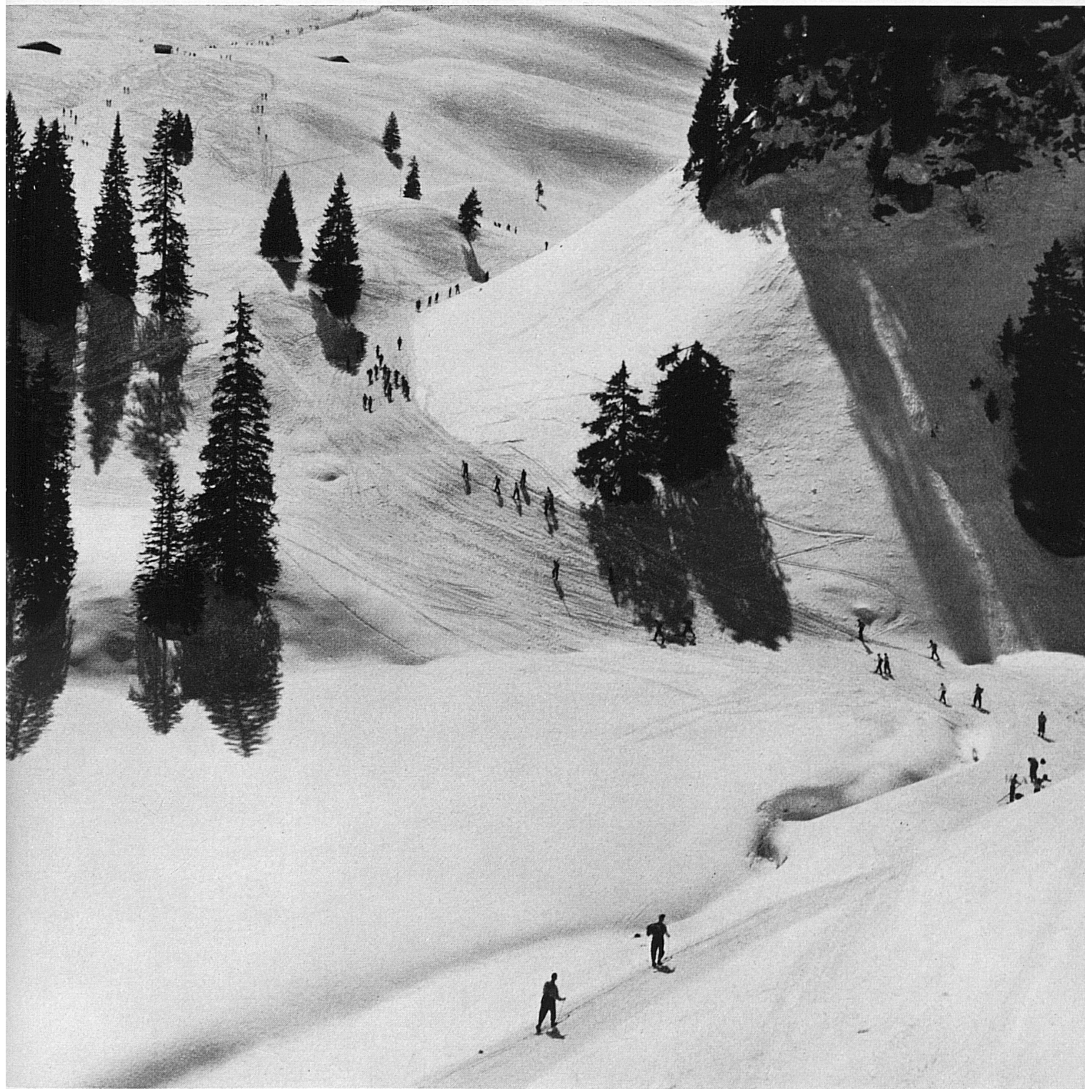
Sonntagsskifahrer im Aufstieg zum Tourengebiet von Oberiberg Le dimanche, les skieurs escaladent les pentes de l'Oberiberg Sciatori domenicali in ascesa verso la regione sciistica di Oberiberg Sunday skiing enthusiasts climb up to the snowy slopes of Oberiberg, Central Switzerland.