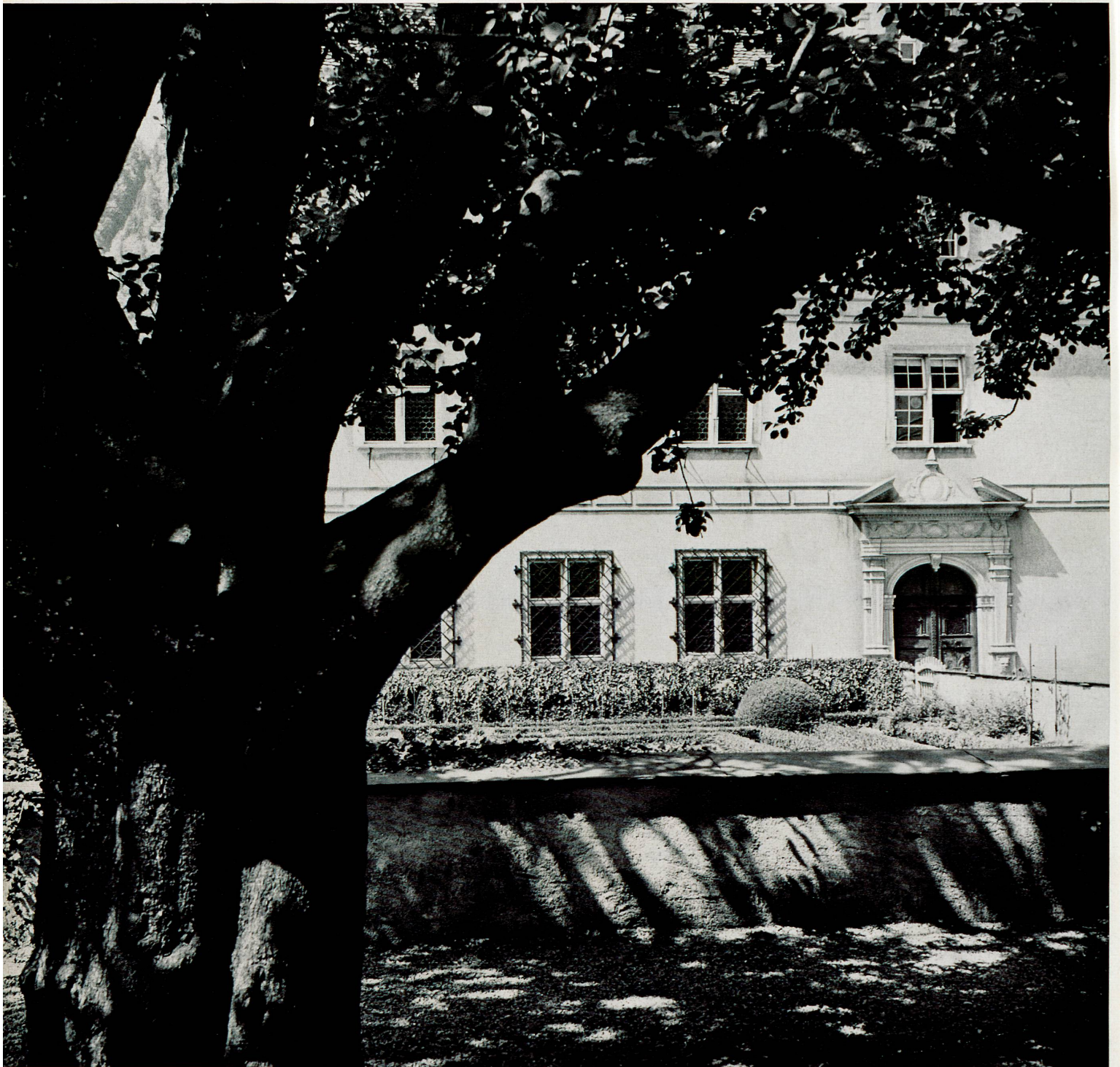
Die Gartenseite des 1642–1647 erbauten Freulerpalastes Les jardins du palais Freuler construit entre 1642 et 1647 Il giardino del Palazzo Freuler a Näfels, costruito negli anni 1642–1647 The Freuler Palace seen from the garden. Built 1642–1647