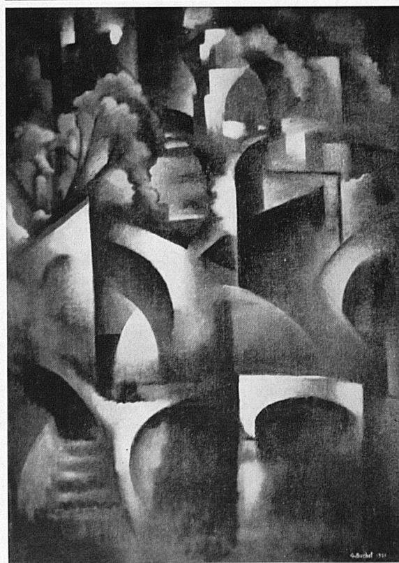
Gustave Buchet: Paysage de rêve , 1951.