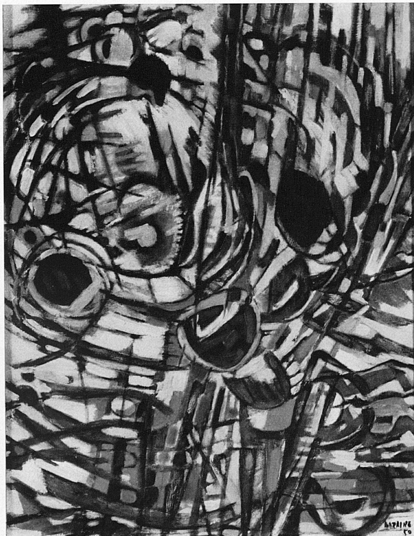
Jean Bazaine: La naissance du jour , 1950