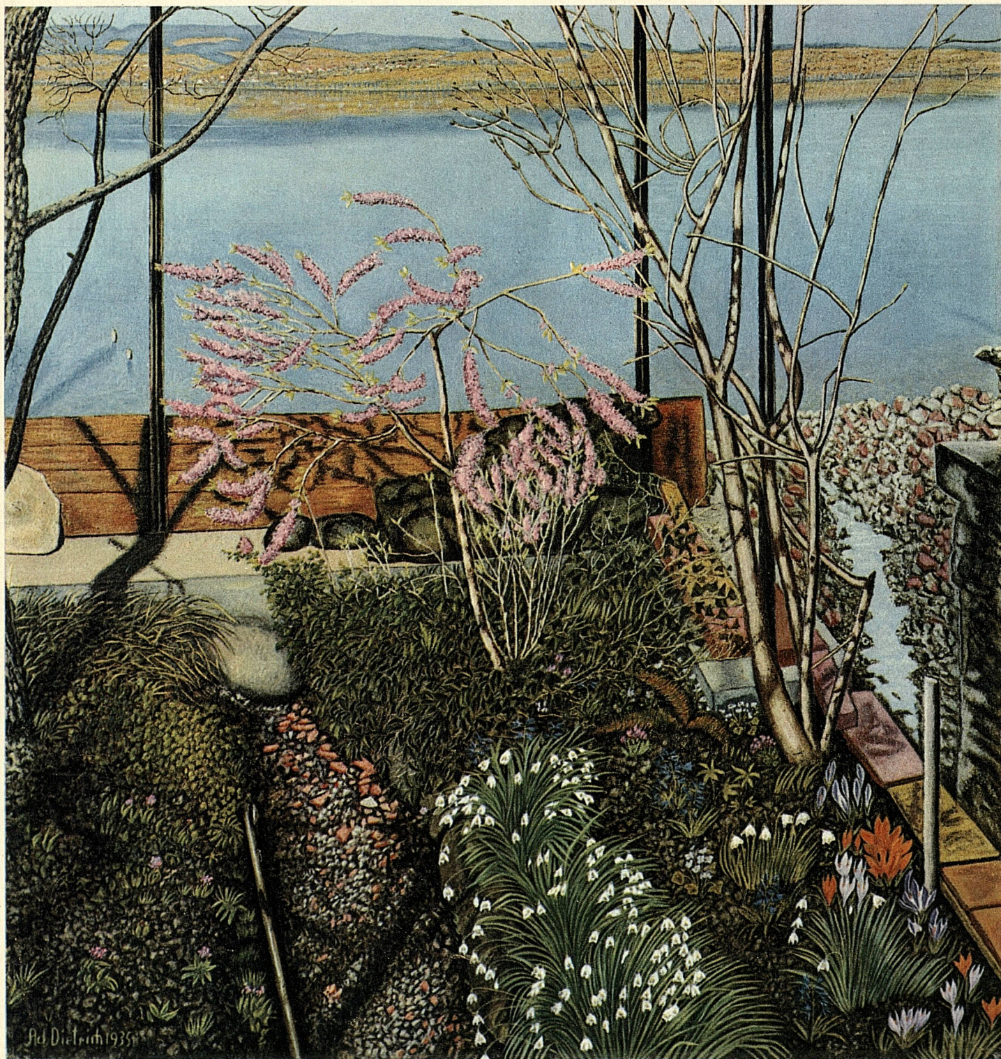
Adolf Dietrich, 1877–1957: «Seidelbast im Garten des Künstlers», am Untersee, 1935

Herausgeber: Schweizerische Verkehrszentrale