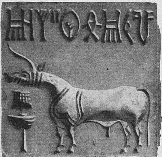
Siegel mit Einhorn, Indus-Tal, 3. Jahrtausend vor Christus Sceau orné d'une licorne, vallée de l'Indus, 3 e mill. av. J.-C. Sigillo con unicorno, del 3 o millennio prima di Cristo, proveniente dalla valle dell'Indo Seal with unicorn, Indus valley, 3 rd millennium B. C.

La grande exposition Art de l'Inde au Kunsthhaus de Zurich, importante manifestation internationale, sera ouverte du 22 novembre au 28 février. Notre numéro de décembre en donnera un reportage illustré.