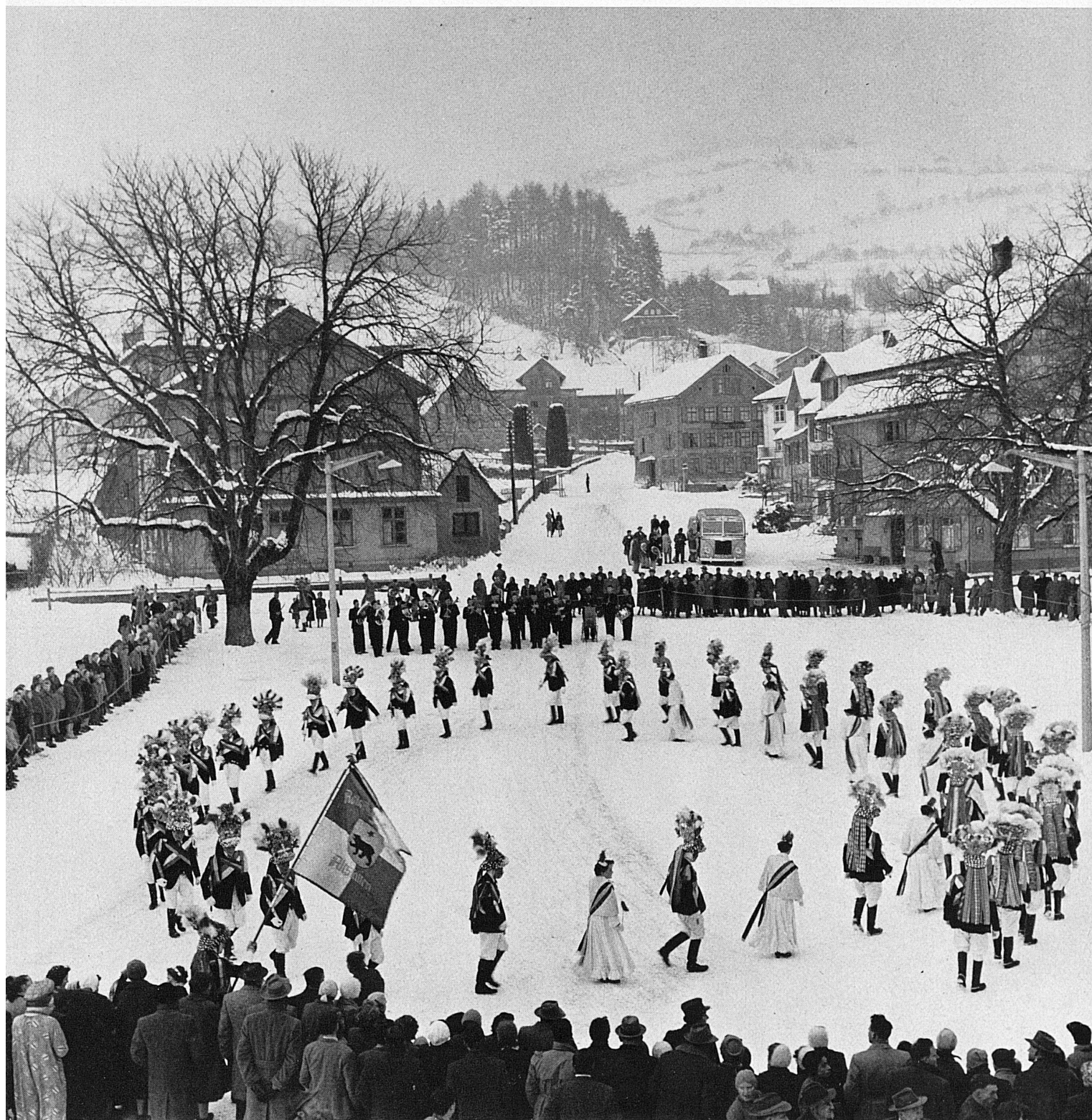
Reigen der fastnächtlichen «Röllelibutzen» in Altstätten im St.-Galler Rheintal.

Danse des «Röllelibutzen» au temps du Carnaval, à Altstätten, dans la vallée du Rhin saint-gallois.