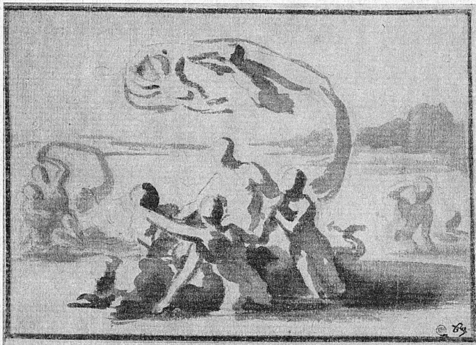
Nicolas Poussin: Triumph der Galathea, Kohle und Sepia – Triomphe de Galathée, fusain et sépia Musée national, Stockholm

DAS 17. JAHRHUNDERT IN DER FRANZÖSISCHEN MALEREI IM KUNSTMUSEUM BERN, BIS 5. APRIL • LA PEINTURE FRANÇAISE DU XVII e SIÈCLE AU MUSÉE DES BEAUX-ARTS DE BERNE, JUSQU'AU 5 AVRIL • ESPOSIZIONE DI PITTURA FRANCESE DEL XVII SECOLO AL KUNSTMUSEUM DI BERNA, FINO AL 5 APRILE SEVENTEENTH-CENTURY FRENCH PAINTINGS IN THE BERNE MUSEUM UNTIL 5 th OF APRIL