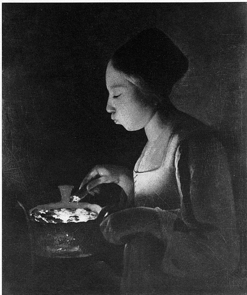
Georges de La Tour: Mädchen mit Kohlenbecken, ▶ 66 × 56 cm – La fillette au braisier, 66 × 56 cm Collection privée, Paris