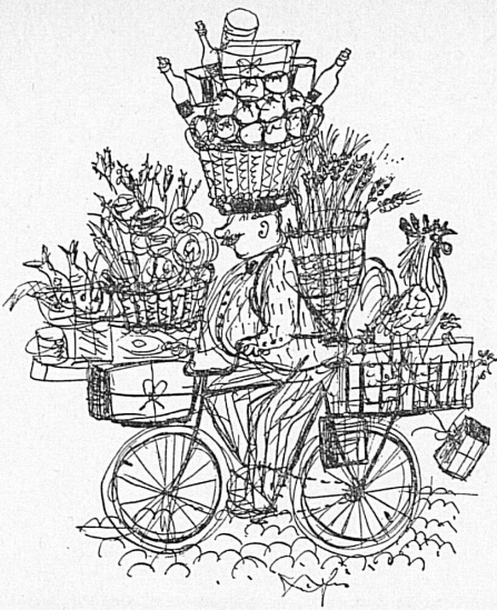
Vignette und kalligraphischer Titel von Hans Fischer Vignette et titre calligraphique de Hans Fischer Illustrazione e titolo calligrafico di Hans Fischer Vignette and calligraphic title by Hans Fischer