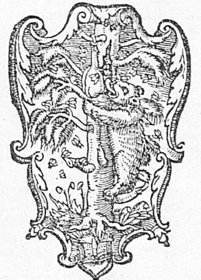
Mathias Apiarius, Bern 1539

Alte schweizerische Buchdrucker- und Verleger-Signete Quelques anciens labels d'imprimeurs et d'éditeurs Antichi emblemi di stampatori ed editori svizzeri Old Swiss insignia of printers and publishers