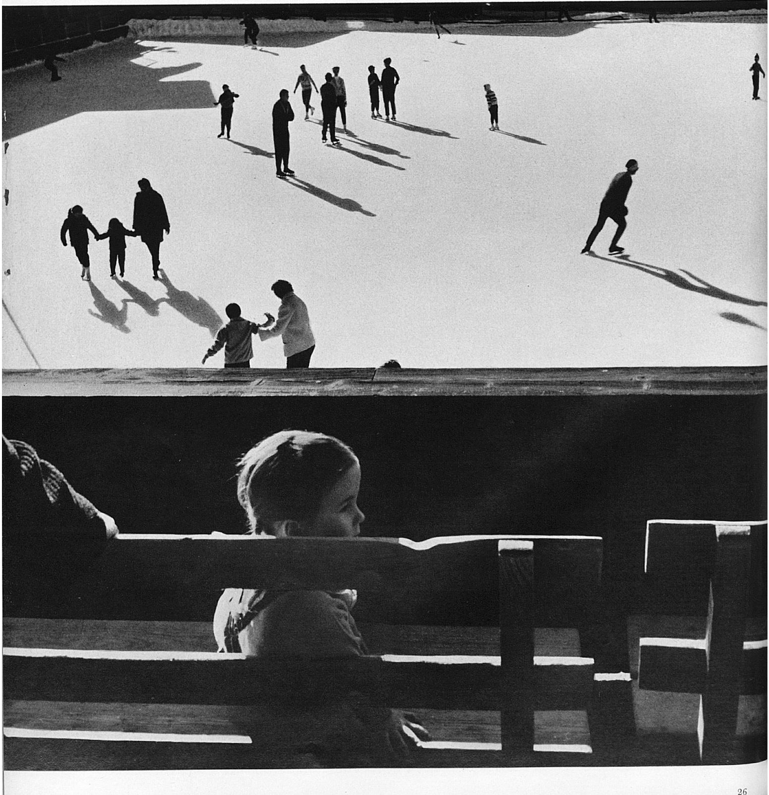
Auf der Eisbahn von Gstaad. Sur la patinoire de Gstaad Sul pattinatoio di Gstaad On Gstaad's inviting skating rink