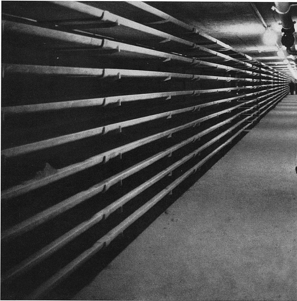
Blick in einen der neuen Kabeltunnels, worin die verschiedenen Kabel gesammelt werden, die der Betrieb eines Großbahnhofes benötigt.