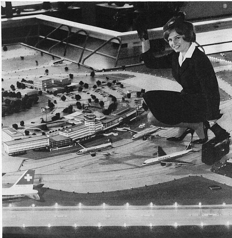
Oben: Flughafenkopf und Flugsteig Links: der Modell-Flughafen