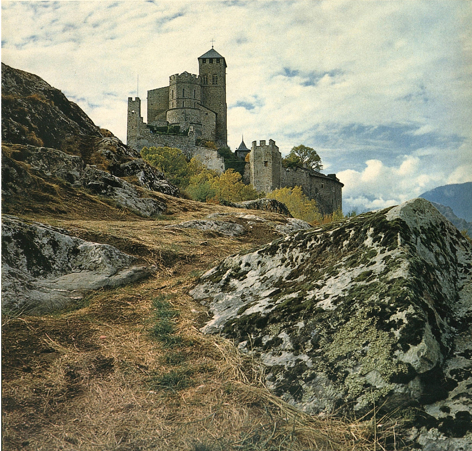
Der kirchliche Burgfelsen Valeria über Sitten im Wallis – L'église forte de Valère dominant Sion, en Valais

Herausgeber: Schweizerische Verkehrszentrale Editeur: Office national suisse du tourisme Editore: Ufficio nazionale svizzero del turismo