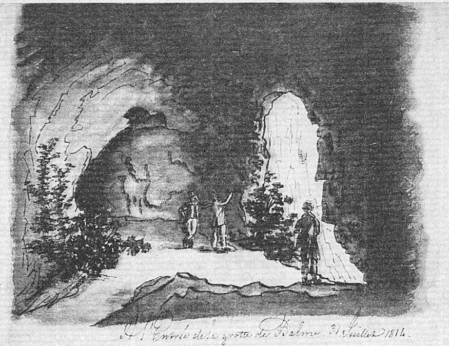
Entrée de la grotte de Balme. 31 juillet 1814.