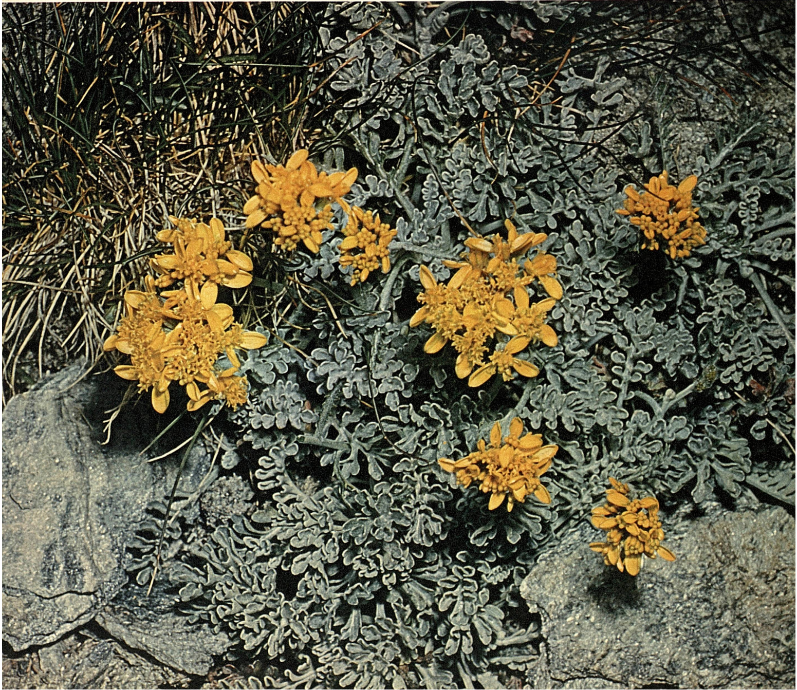
Graues Kreuzkraut / Sénégon blanchâtre (Senecio incanus)

Herausgeber: Schweizerische Verkehrszentrale Editeur: Office national suisse du tourisme Editore: Ufficio nazionale svizzero del turismo