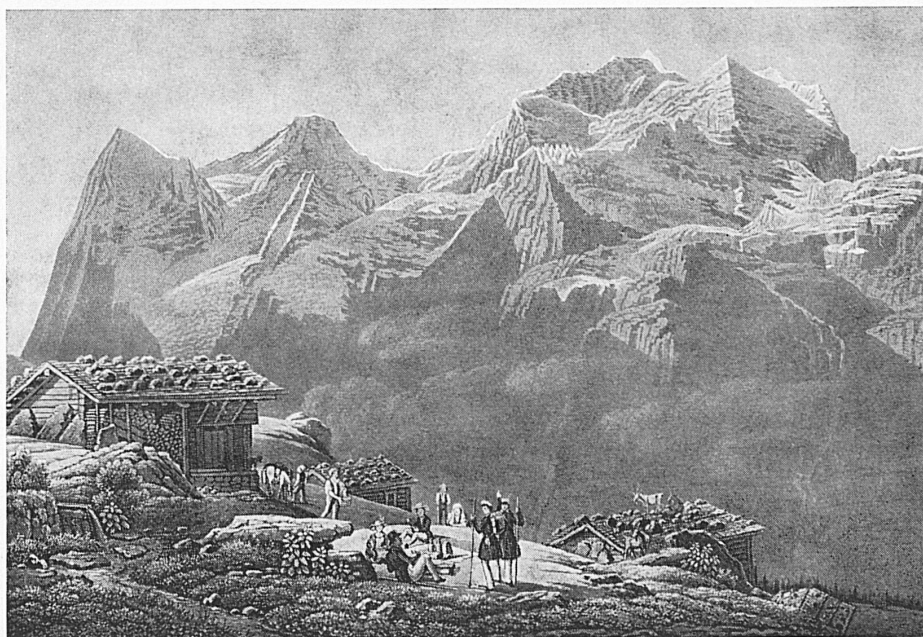
Wengernalp und Jungfrau Gruppe, Zeichnung von Gabriel Lory fils, erste Hälfte 19. Jahrhundert Wengernalp et le massif de la Jungfrau, dessin de Gabriel Lory fils, première moitié du XIX e siècle Wengernalp e gruppo della Jungfrau, disegno di Gabriel Lory figlio, prima metà del XIX secolo Wengernalp and Jungfrau group, drawing by Gabriel Lory the Younger, first half of the 19 th century

Far along, From peak to peak, the rattling crags among Leaps the live thunder! Not from one lone cloud, But every mountain now hath found a tongue, And Jura answers from her misty shroud Back to the joyous Alps, who call to her aloud!