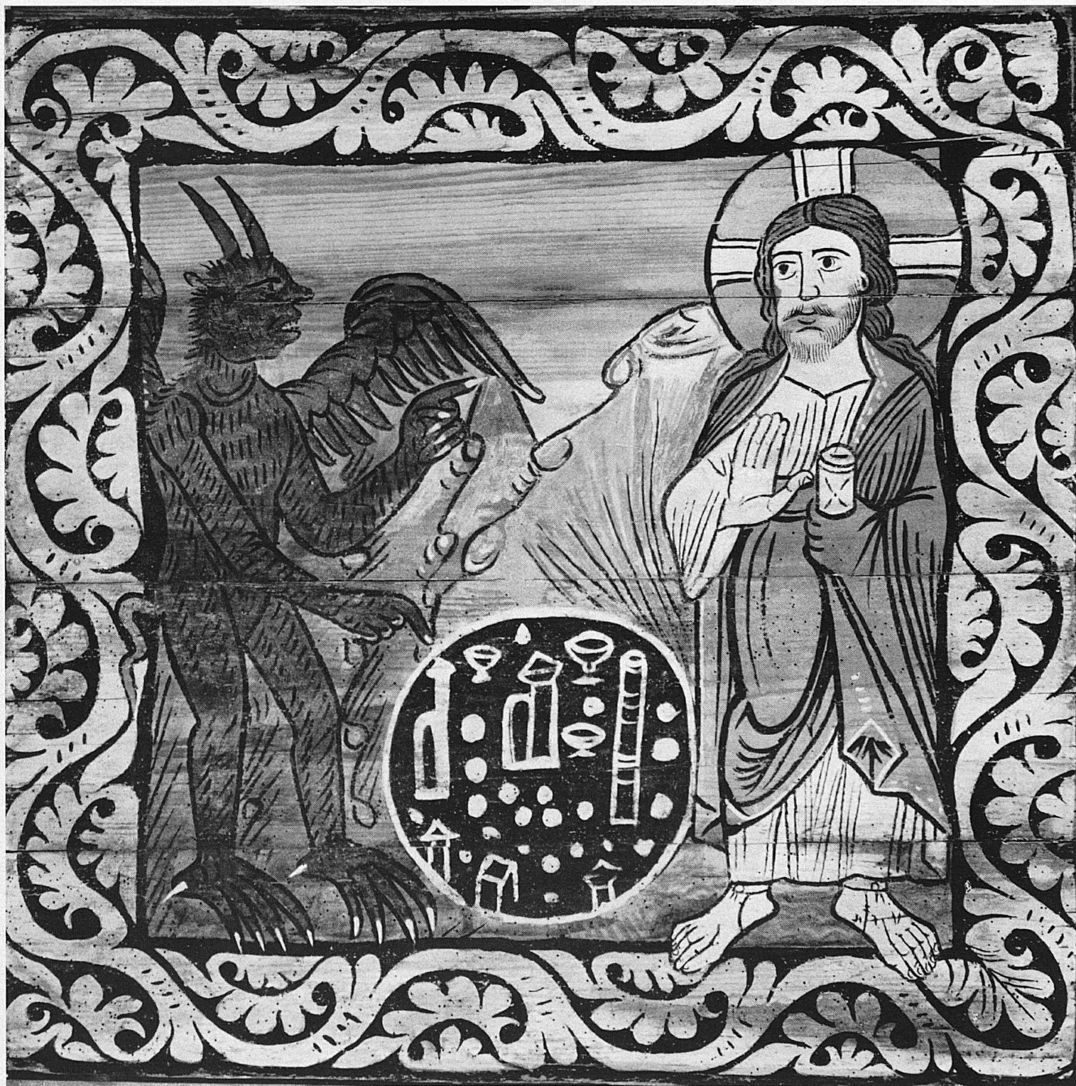
Zillis, Darstellung aus der Dreifachen Versuchung Christi • Zillis: la triple tentation du Christ Zillis, la triplice tentazione di Cristo • Zillis, representation of the Threefold Temptation of Christ

Darstellung eines Ballspielers und seiner Ausrüstung aus der klassischen Periode ca. 590 n. Chr. Der Spieler trägt Knieschoner, breiten Gürtel oder sogenanntes Joch und Armstulpe. Museo Nacional de Antropología, Mexiko. Aus der Ausstellung «Altes Sportland Mexiko» im Schweizerischen Turn- und Sportmuseum in Basel.