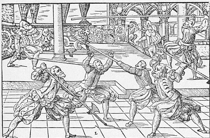
Fechten mit der Hellebarde. Aus der «Grüntlichen Beschreibung der freyen Ritterlichen und Adelichen Kunst des Fechtens» von J. Meyer, Strassburg 1570.

◀ Wirtshauschild «Zur Linde» in Diessenhofen, Kanton Thurgau Enseigne de l'auberge «Zur Linde» à Diessenhofen, canton de Thurgovie Insegna della Locanda del Tiglio, a Diessenhofen, nel Cantone di Turgovia Inn sign "Zur Linde" at Diessenhofen, canton of Thurgau