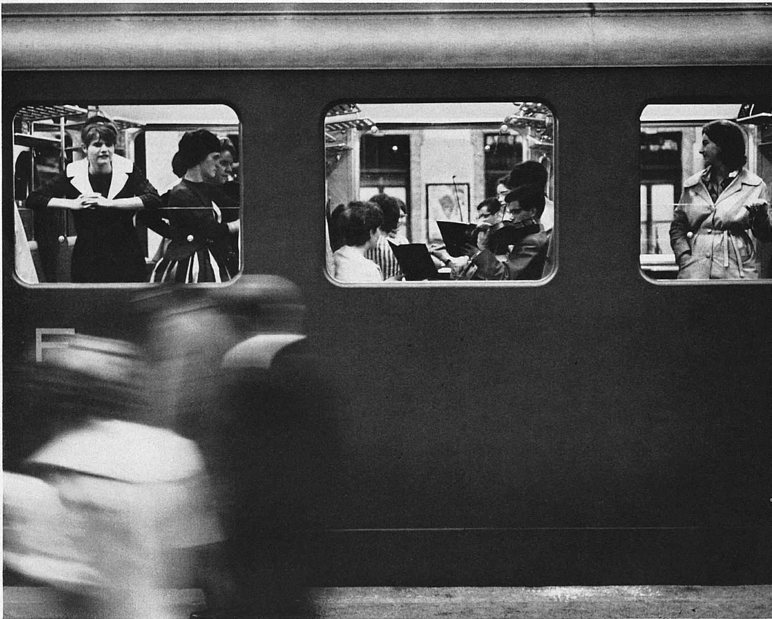
Fröhliche Fahrt mit den Bundesbahnen. Gai voyage avec les Chemins de fer fédéraux Buon viaggio con i treni delle Ferrovie federali svizzere Happily on the way, on the Swiss Federal Railways

Nahe der Aaremündung in den Thunersee, 5 km südwestlich von Interlaken, überragt die Burgruine Weissenau ein weites Naturschutzgebiet. Nach Thun und Spiez war diese Feste einst der bedeutendste militärische Stützpunkt des Berner Oberlandes. Errichtet wurde die Burg von dem um das Jahr 1507 gestorbenen Freiherrn Rudolf III. von Weissenburg. Später Besitztum des Klosters Interlaken, kam sie nach dessen Aufhebung an Bern, das sie zerfallen liess.