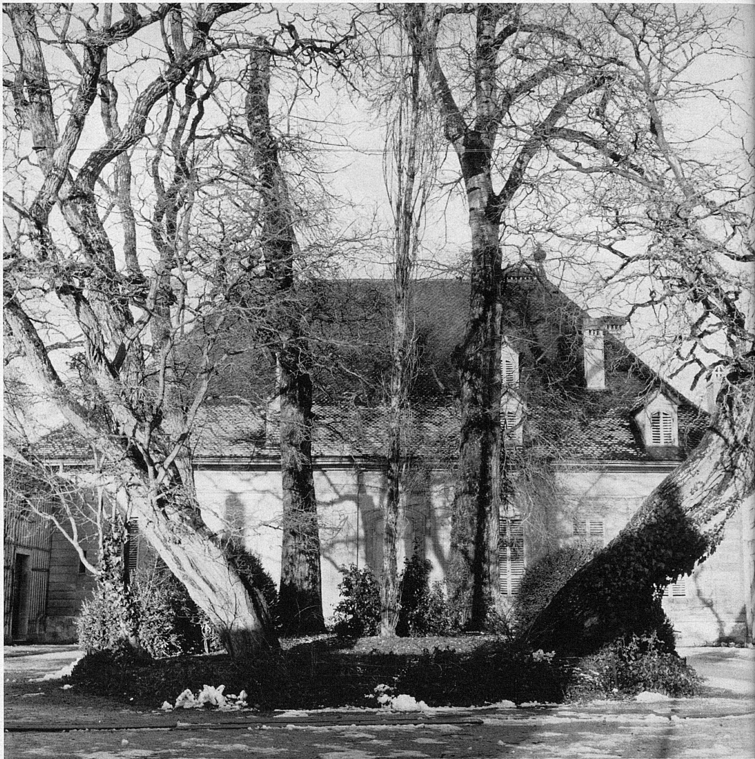
Das 1715–1715 nach Plänen von N. Abeille erbaute Herrenhaus in Thunstetten, Kanton Bern Le petit Château de Thunstetten, Berne, construit de 1715 à 1715 d'après les plans de N. Abeille La cosiddetta Herrenhaus a Thunstetten (Cantone di Berna), costruita negli anni 1715–1715, secondo i disegni di N. Abeille The manor in Thunstetten, Canton of Berne, built according to plans of N. Abeille in 1715–1715.

Flugbild der Stadt Solothurn. Im Vordergrund die Westfront der Altstadt mit dem Bieltor. Am oberen Bildrand die St.-Ursen-Kathedrale. Diese ist ein in den Jahren 1762–1775 errichtetes barock-klassizistisches Werk der Tessiner Baukünstler Gaetano Matteo Pisoni aus Ascona und seines Neffen Paolo Antonio.