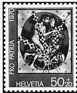
Glasgemälde zeitgenössischer Künstler