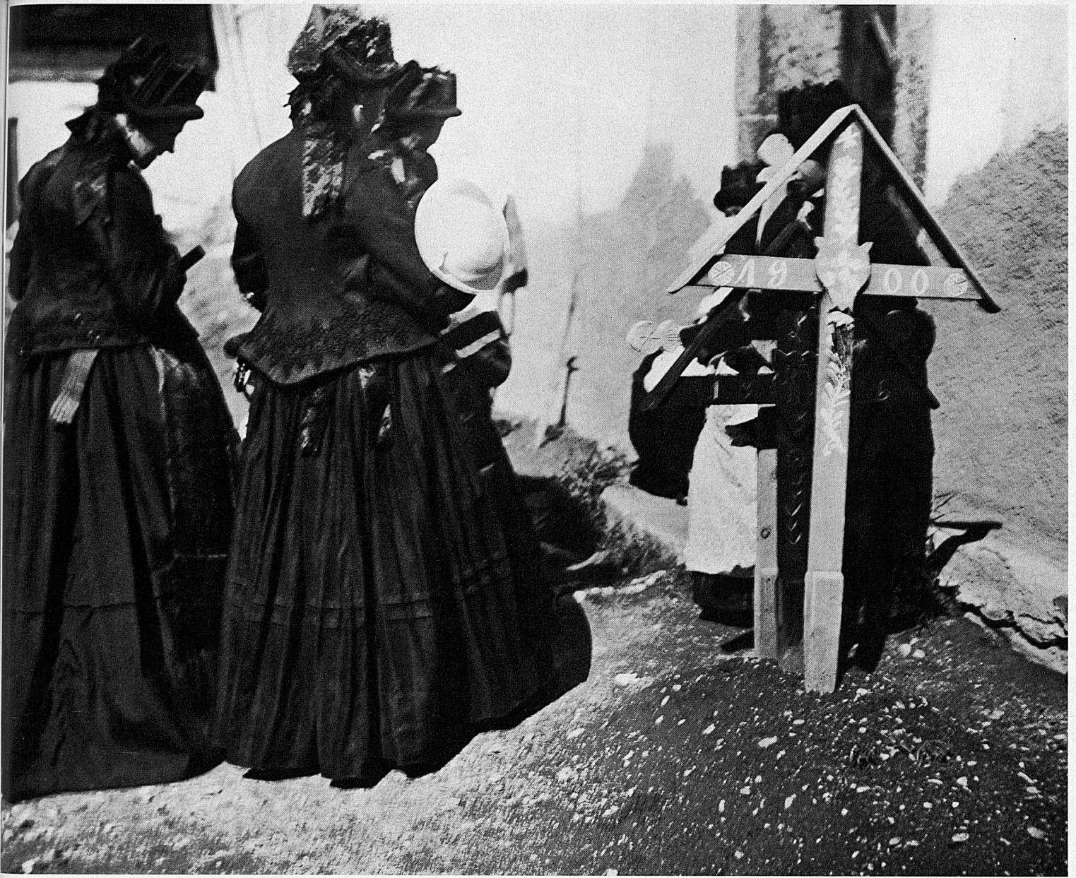
Lötschentalerinnen in der Festtagstracht auf dem Friedhof. Au cimetière. Femmes du Lötschental en costume de fête Donne del Lötschental, in costume festivo, al cimitero Women from Lötschental in their festive costume at the cemetery