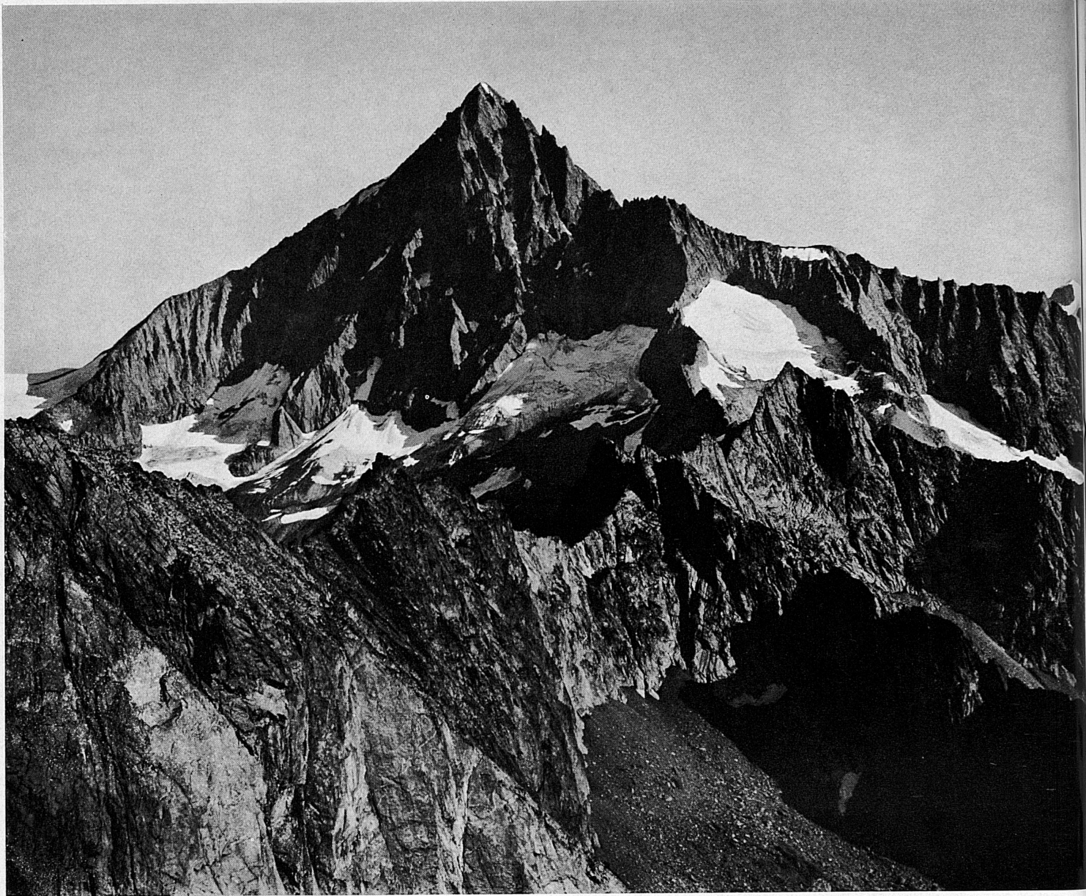
Das Bietschhorn, von Süden her gesehen Le Bietschhorn, vu du sud Il Bietschhorn, visto da sud The Bietschhorn as seen from the south