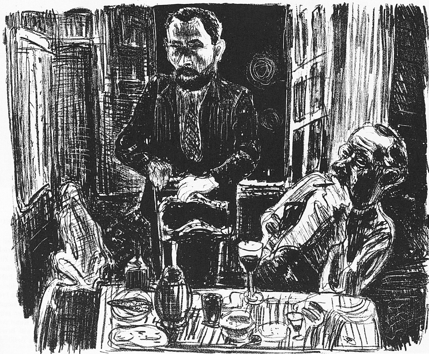
Fritz Pauli, 1927: Les amis, lithographie

ISSUED BY THE SWISS NATIONAL TOURIST OFFICE · 8023 ZÜRICH, TALACKER 42