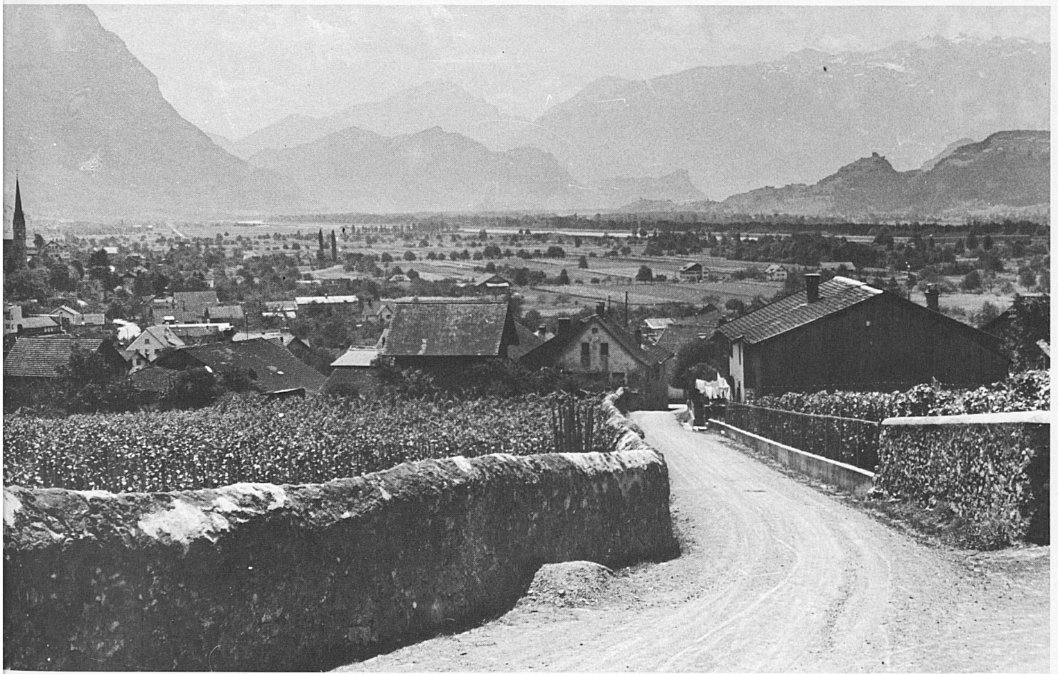
Alt-Vaduz, Liechtensteiner und St.-Galler Oberland. Alt-Vaduz, Oberland del Liechtenstein e di San Gallo