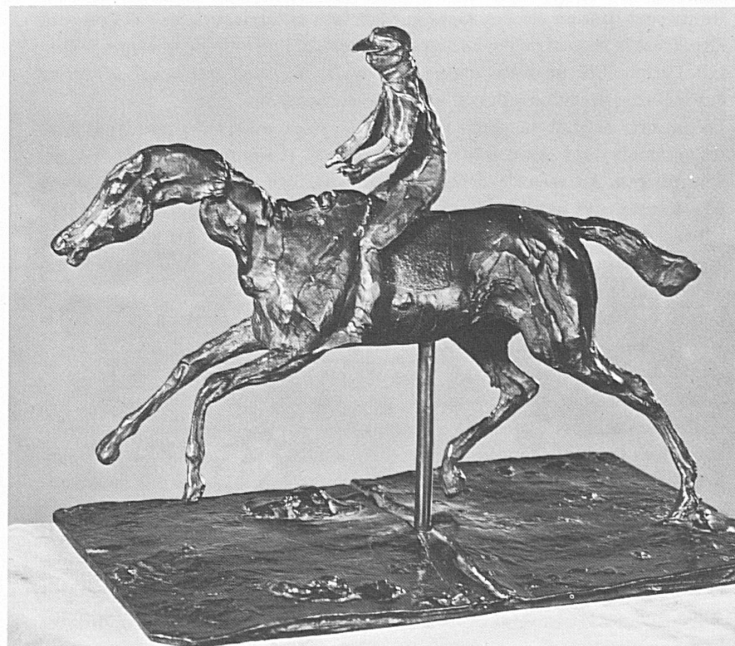
EDGAR DEGAS (1834–1917): «CHEVAL ET JOCKEY»

Vom 30. Juni bis zum 9. Juli finden auch pferdesportliche Veranstaltungen statt: Pferderennen, Concours hippiques, Dressurprüfungen, Militaries usw., darunter eine grosse französisch-schweizerische Sprungkonkurrenz, eine Demonstration von Kosaken und auch ein Ponyrennen. – Als hübsche Beigabe