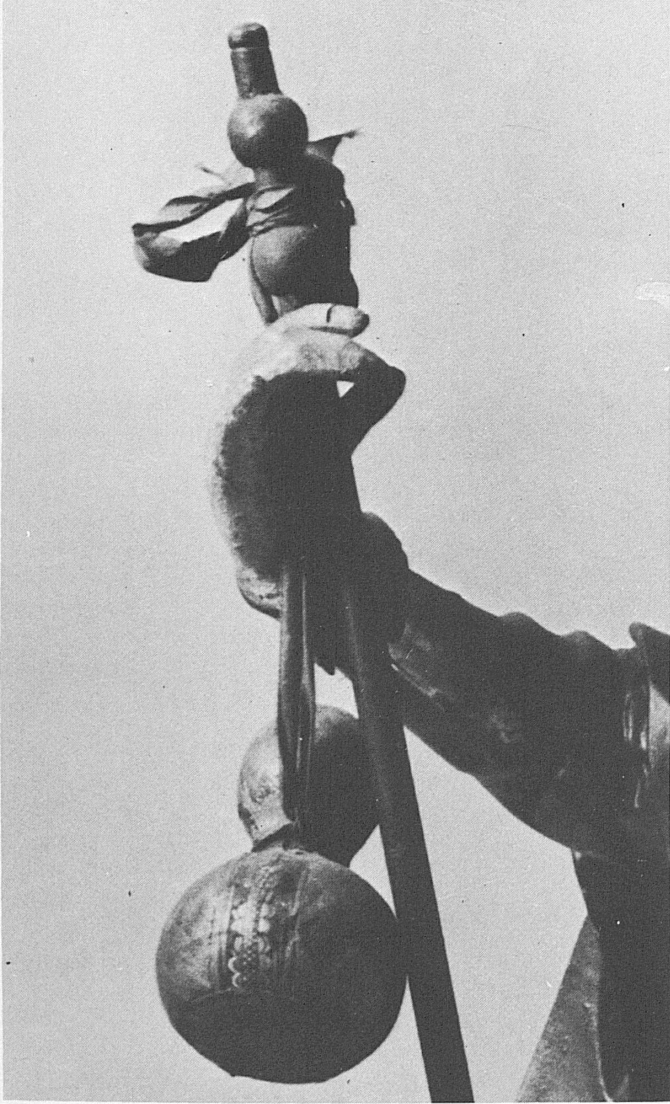
Der Flaschenkürbis hängt auch am Pilgerstab mancher heiliger Wanderer, so auch an demjenigen des S. Rocco. Teilaufnahme der um 1600 entstandenen San-Rocco-Statue in der Kirche S. Antonio, Locarno.