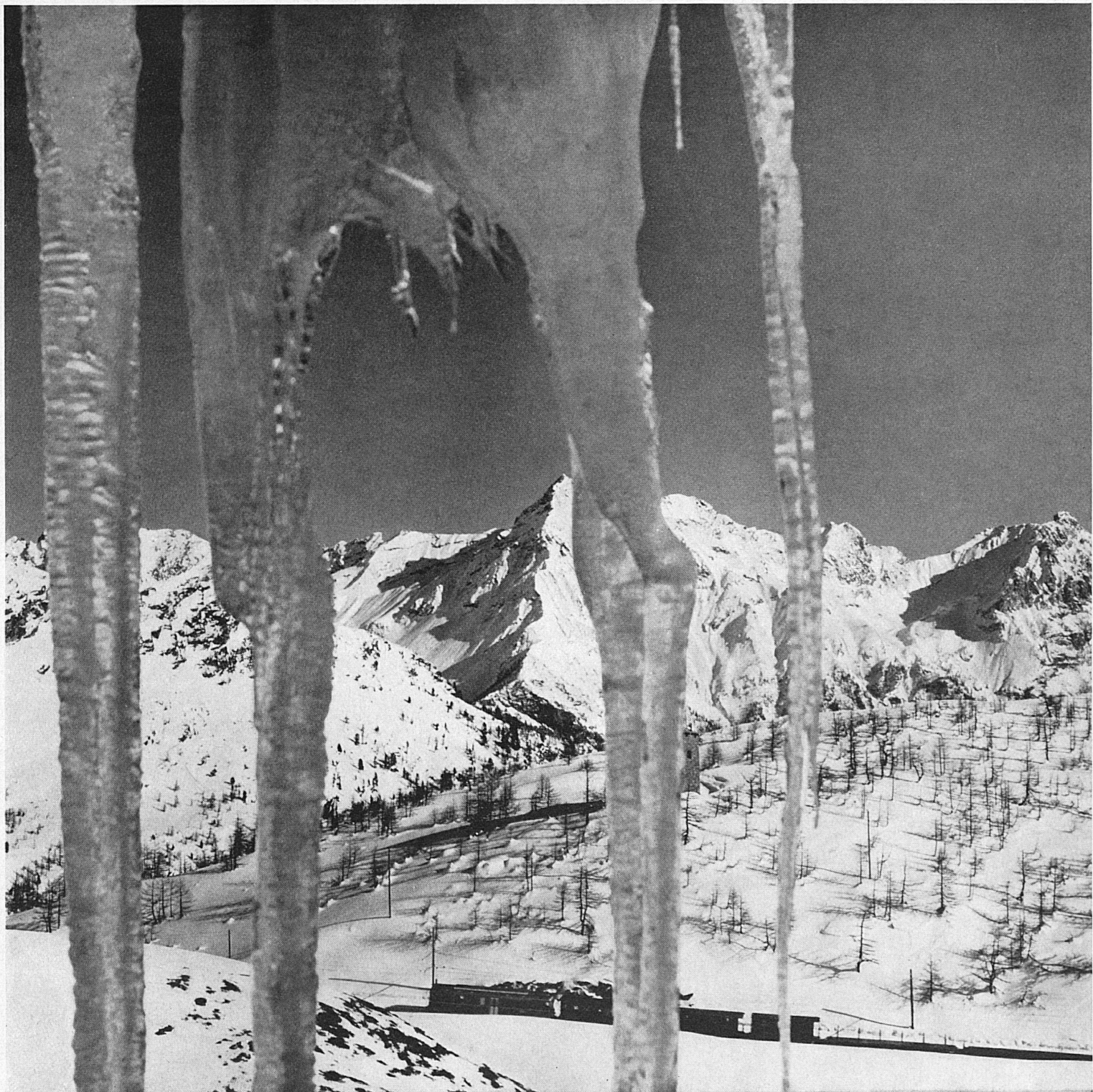
Die Berninabahn oberhalb Alp Grüm im Puschlav Un convoi du Chemin de fer de la Bernina au-dessus d'Alp Grüm, dans la vallée de Poschiavo La ferrovia del Bernina nel tratto sovrastante l'Alp Grüm, in Val Poschiavo The Bernina Railway above Alp Grüm in the Poschiavo Valley