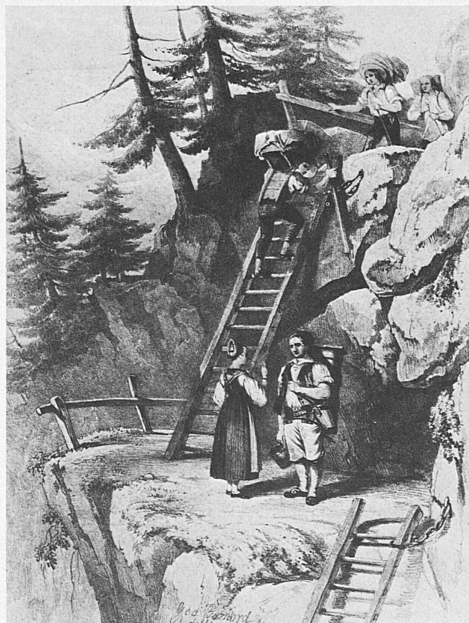
When the ladders of Albinen were still the fastest means of transporting farm produce from the mountain village to Leukerbad, the famous watering-place below it. Lithographs dating from c. 1828 and 1843

Albinen ! Le village est perché à 1274 m comme un nid d'hirondelles entre ses champs et ses prés en pente abrupte. Au milieu des chalets de bois sombre se dresse le clocher blanc d'une église moderne. Les avis à son sujet sont partagés : Est-ce un doigt qui se lève menaçant ou une promesse de salut ? Est-ce une tentative de synthèse entre deux époques ou l'intrusion d'un style étranger ? Mais le regard ne s'y attarde pas car voici plus loin, sur les coteaux de la montagne, un autre clocher qui vous fait signe, et déjà la vue s'ouvre sur les vignobles rhodaniens de Varonne et de Salquenen. Au-delà encore se dressent deux autres clochers, et c'est le Valais romand qui apparaît : Sierre sous son soleil, puis Sion à demi caché derrière ses col-