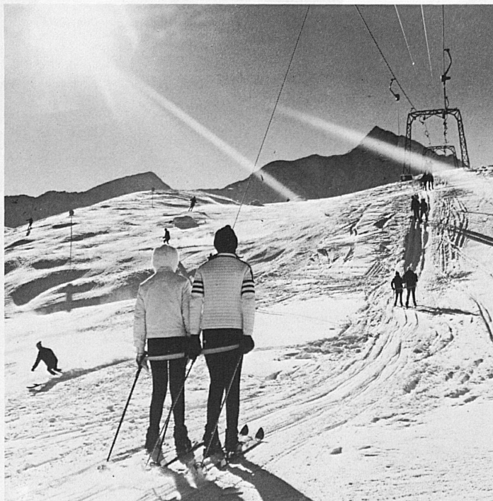
Splügen: Skilift Danaz mit Piz Tambo

Verlangen Sie Spezialprospekt beim Kur- und Verkehrsverein 7250 Klosters Telefon 083 4 18 77 / 78 oder Klosters Dorf 083 4 19 78