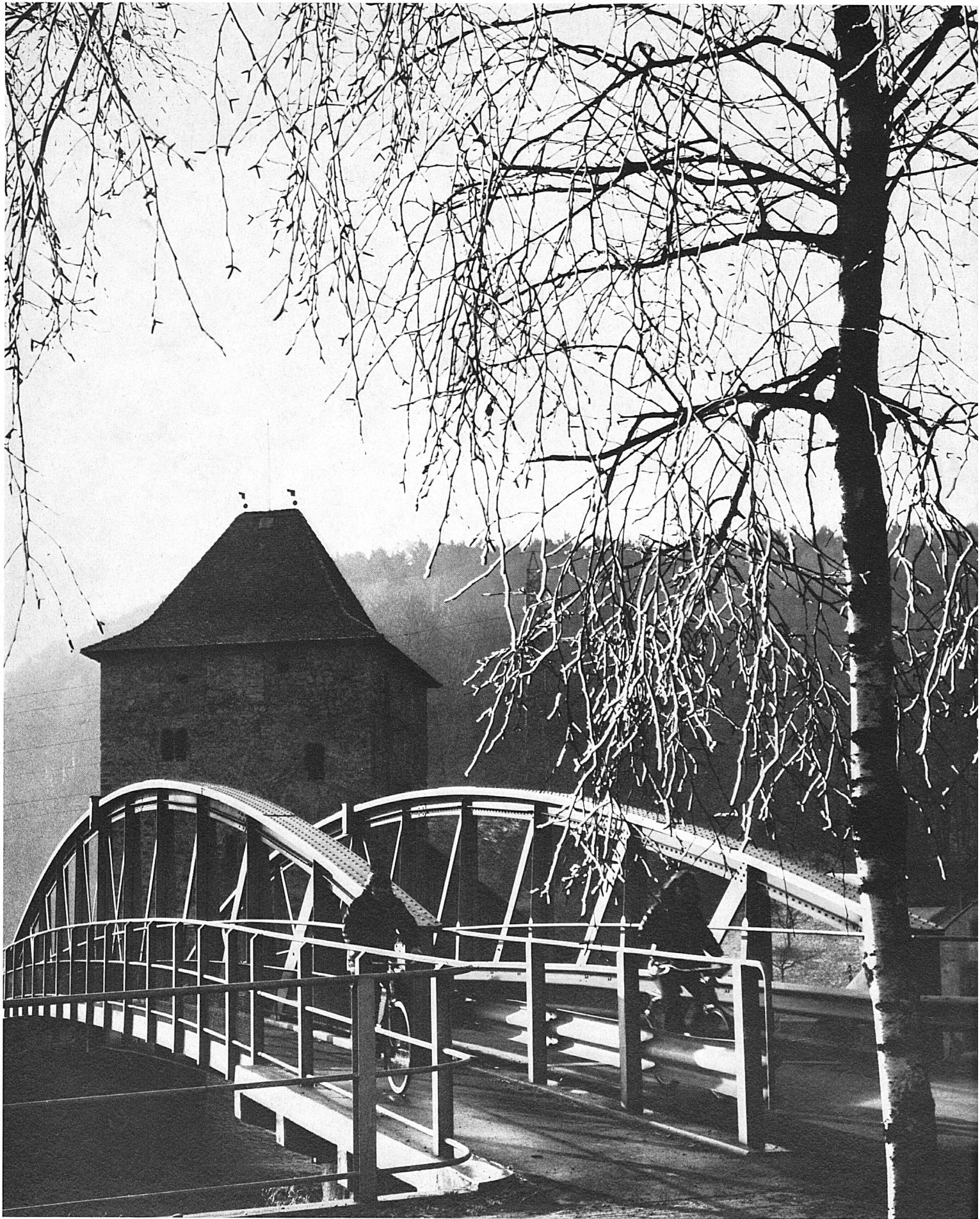
Schloss Grynau an der Brücke über den Linthkanal. Le Château de Grynau, près du pont qui franchit le canal de la Linth