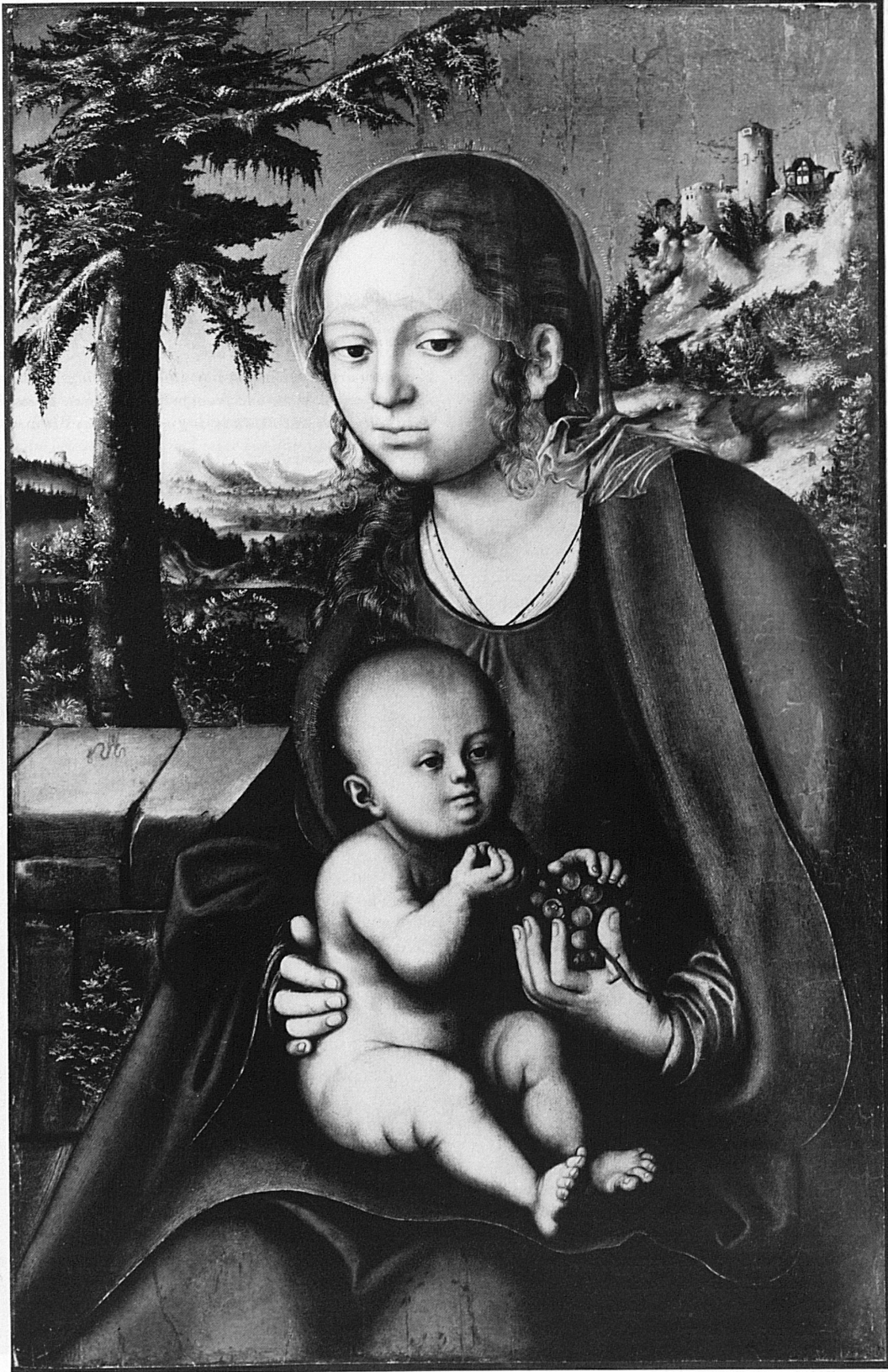
Lukas Cranach d. Ä.: Madonna, um 1510, 71 × 51, Sammlung Thyssen, Castagnola bei Lugano