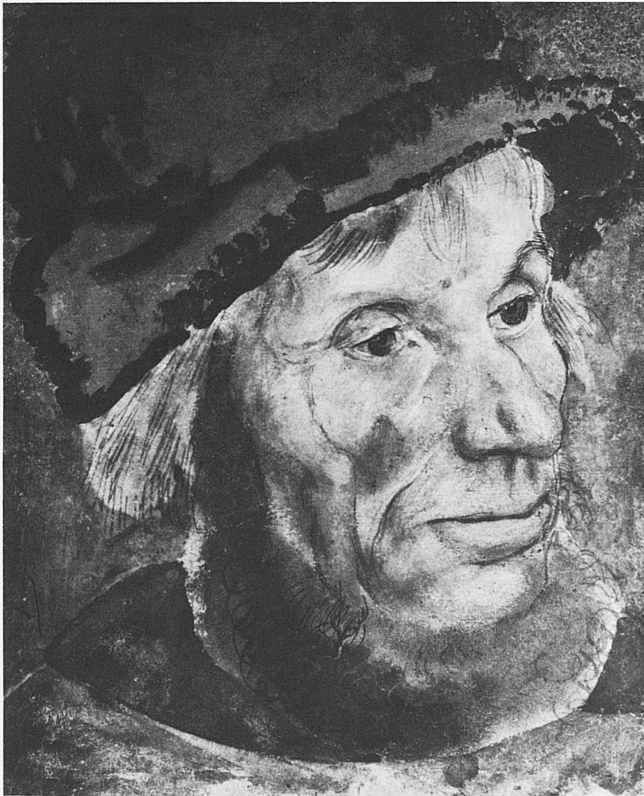
Lukas Cranach d. Ä.: Bauernkopf, um 1520, Aquarell, 19,2 × 15,6 cm, Kunstmuseum Basel