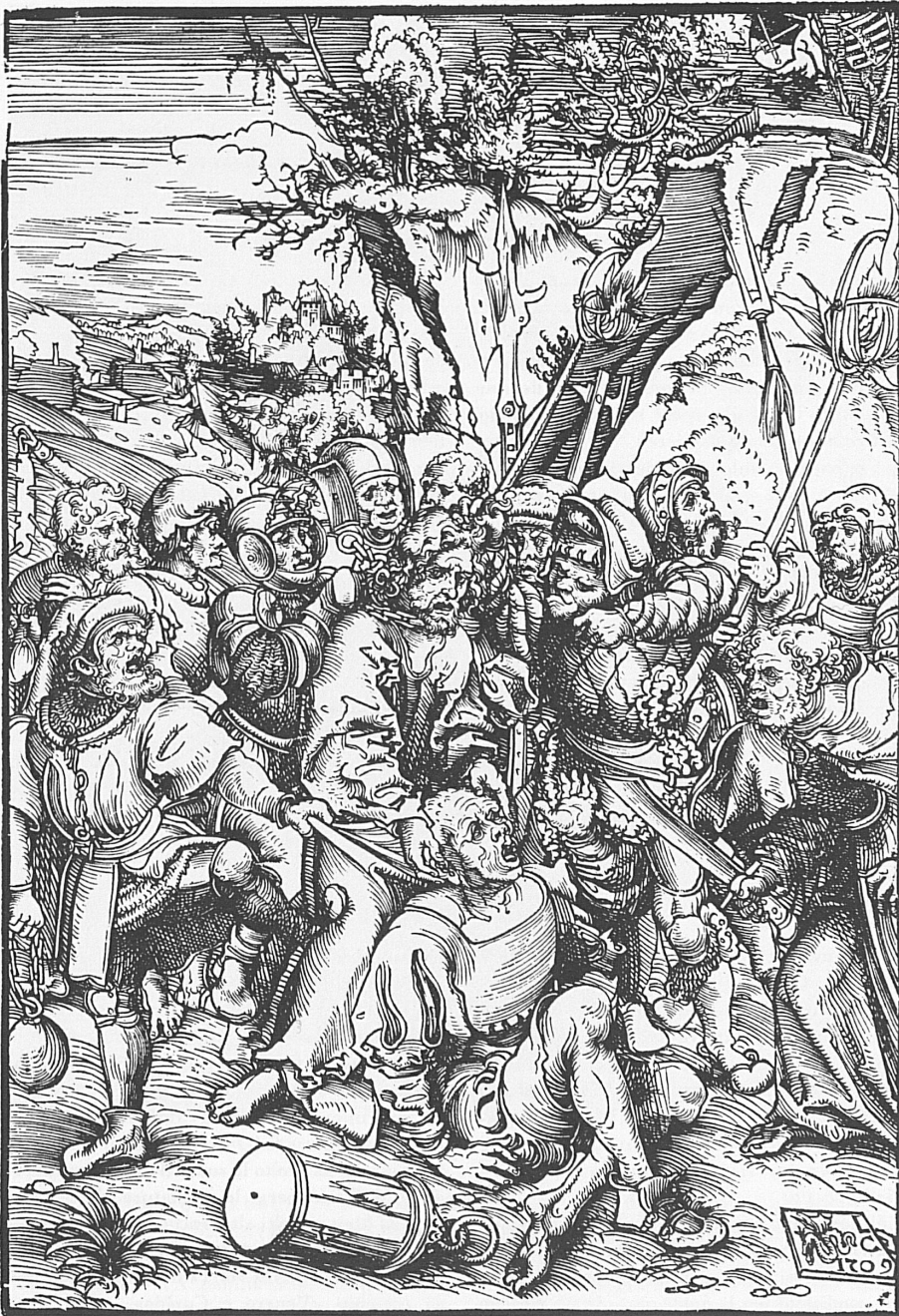
Lukas Cranach d. Ä.: Gefangennahme Christi , Holzschnitt, 1509, 25 × 17,2 cm. Der Spiess-träger am rechten Bildrand ist Cranachs Selbst-bildnis