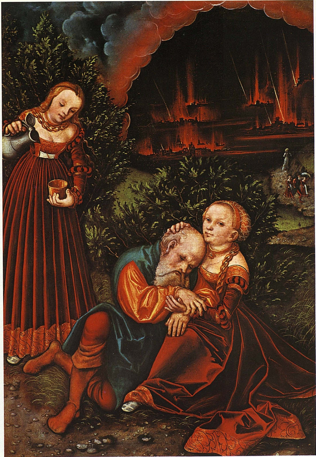
Lukas Cranach d. Ae.: Lot und seine Töchter, um 1530, 56 × 39 cm, Privatbesitz USA